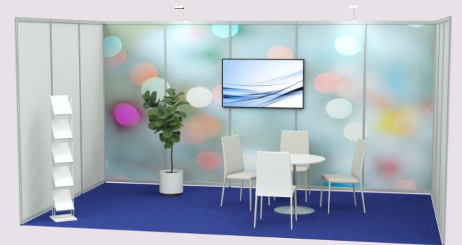
Premium osastopaketti kalustettuna