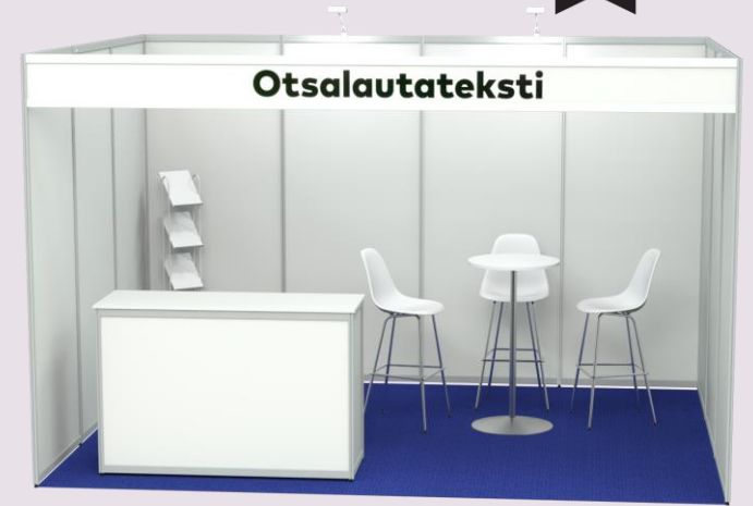
Basic osastopaketti kalustettuna